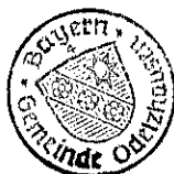
Markus Trinkl 1. Bürgermeister